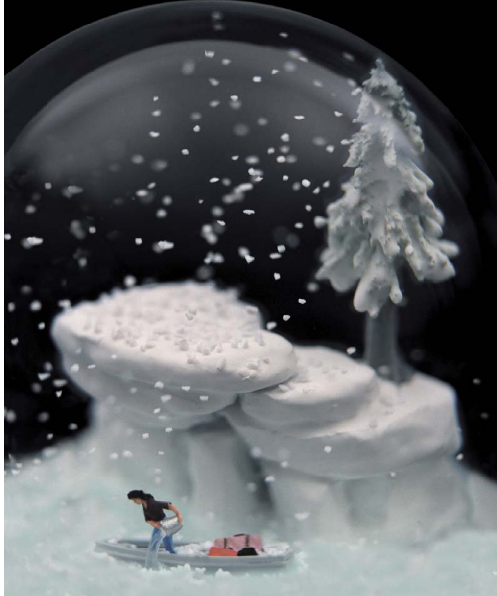
“Traveler 94 at night”

El recurso al gótico por parte de la pareja de artistas, posee otra arista que nos aporta una clave definitiva para la interpretación de esa especie de rol de medium epocal que parecen encarnar. Han revelado en entrevistas su inspiración y amor por el arte flamenco, por la vitalidad de sus coloridos, por los grabados simbólicos del siglo XV –concretamente las obras de Bruegel y Joachim Patinir–, que además de impulsar algunos de sus trabajos como The Nursery o A Winter Walk , sirven