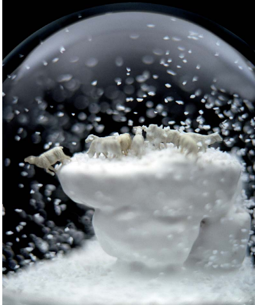
"Traveler 88 at Night"

The connection with the artistic tradition of German romanticism is not a coincidence - that which starts on this path and leads to the abyss of men against nature - the infinite horizons as representation of a surrounding void, the cliffs inviting the fall, knotty forests - the smallness against the outside, that in the paintings of Caspar David Fiedrich is expressed with more force and nudity, as in the case of the splendid Monk by the sea , whose vastness transmutes in an omnipresent void, or The abbey in the oak grove where gloomy trees and their shadowy chapel lay a bridge towards the origins of the medieval gothic.