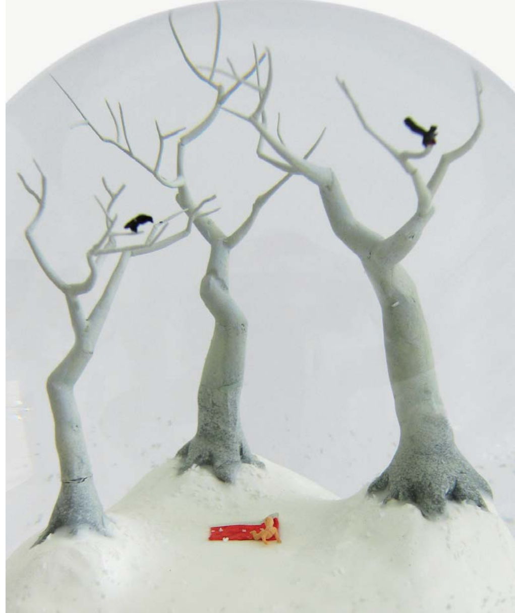
"Traveler 247" Detalle objeto. 2003. 89 x 108 cm.

The art that survives the passage of time is perhaps the one that engages in dialogue with different traditions, and their work largely does so, so the reflexive potential of this exhibition goes in hand with its aesthetic taste. We shall say no more. Except that the explosive experience of isolation in the "made rare" atmosphere of Christmas with snow, and made stronger because by the daily presence of the artists, we may only have two paths: becoming psychopaths like the memorable character of Jack Nicholson in The Shinning of Kubrick or producing a miniature world, of adventure and gothic riddles, amusing and gloomy, as Walter and Paloma.