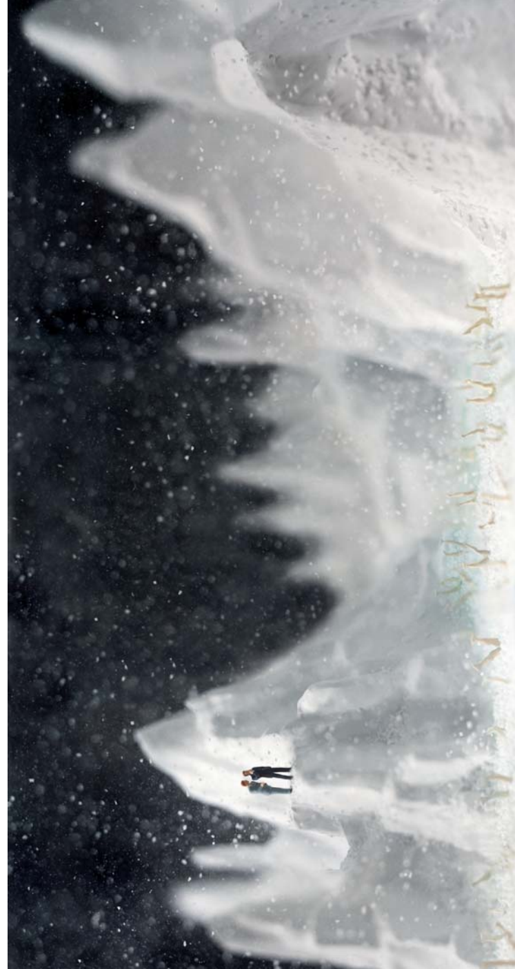
"The Great Frozen Lake" Edición de 6. C-Print, montada en plexi, abrazaderas de aluminio. 2005. 89 x 170 cm.